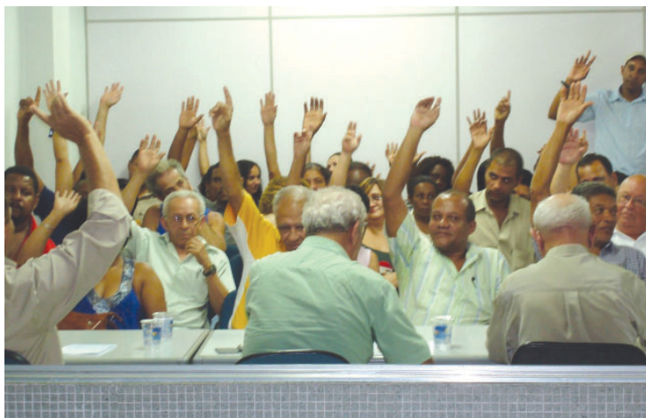
Assembléia aprova o percentual de reajuste de 20%

ção do aumento, vários outros itens compõe a pauta aprovada pela assembléia, alguns se referem à manutenção de benefícios anteriormente conquistados pelo Sindicato e outros são reivindicações novas (veja na página 2 as principais cláusulas).